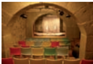
Langnauer Kellertheater Schlossstrasse 6, Langnau, 034 402 12 79 www.keller-theater.ch, lamaus@freesurf.ch

Im 1985 gegründeten, renommierten Langnauer Kellertheater wird eine breite Palette an künstlerischen Darbietungen berücksichtigt: Theater, Literatur, Kabarett in allen Variationen, Chansons, Kinder- und Familienvorstellungen, Zauberei und Clowns. Äusserst vielseitig ist auch das Angebot im Bereich Musik: Jazz, Worldmusic, Folk...